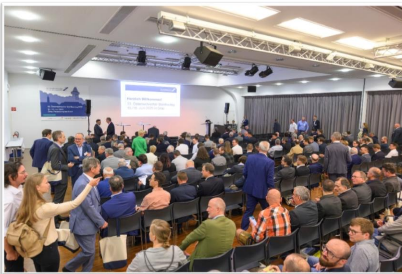
Vortragssaal (Säle 12a + 12b) (Kapazität bei Kinobestuhlung: 300 Personen)